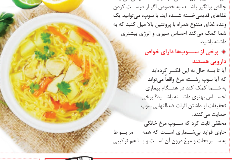
محتوای آب با بالاتر

دریافت پروتئین کافی در هر وعده غذایی می‌تواند چالش برانگیز باشد، به‌خصوص اگر در دست کردن غذاهای قدیمی‌خسته شده آید. با سوپ، می‌توانید یک وعده غذای متنوع همراه با پروتئین بالا میل کنید که به شما کمک می‌کند احساس سبوری و انرژی بیشتری داشته باشید. ◆ برخی از سوپ‌ها دارای خواص دارویی هستند آیا تا به حال به این فکر کرده‌اید که آیا سوپ رشته مرغ واقعاً می‌تواند به شما کمک کند در هنگام بیماری احساس بهتری داشته باشید؟ برخی تحقیقات از داشتن اثرات ضدالتهابی سوپ حمایت می‌کنند. محققان ثابت کرد که سوپ مرغ خانگی حاوی فواید بی‌شماری است که همه مربوط به سبزیجات و مرغ درون آن است و با هم ترکیبی